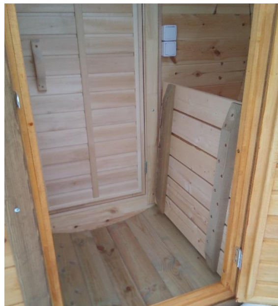
Трапы на шарнирах в вертикальном положении.