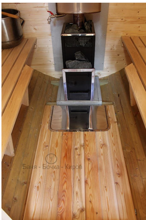
Парильное отделение и печное оборудование общий вид. Трапы на шарнирах в горизонтально положении.