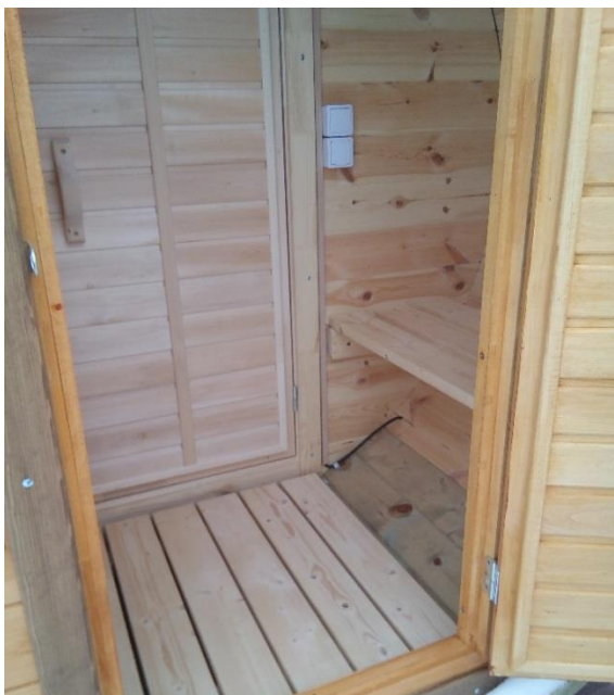
Трапы на шарнирах в горизонтально положении.