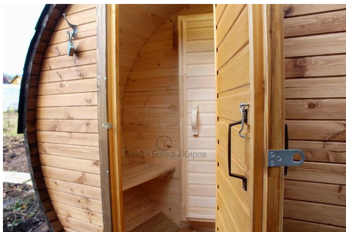
Дверь входная покрашена полностью.