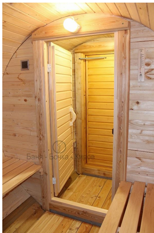
Дверь в парную каркасная из липовой вагонки.