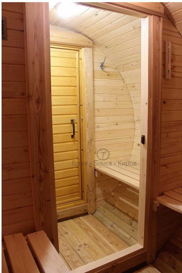
Полки из липы.